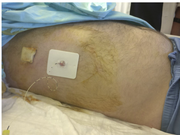
Figura 2 A agulha foi removida e o cateter fixado com adesivo.

dia seguinte, o paciente conseguiu se levantar e sentar na cadeira ao lado da cama e relatou um escore NRS = 0 em repouso, com escore NRS = 3 em mobilização. No terceiro dia após a colocação do cateter, devido ao resultado favorável, foi transferido para a enfermaria cirúrgica. A infusão de AL foi mantida por cinco dias e depois descontinuada. O paciente foi mantido em paracetamol e AINEs, mas não precisou de terapia com opioides após a colocação do cateter. Permaneceu confortável em todos os momentos e também capaz de movimentar-se. No terceiro dia após a retirada do cateter, recebeu alta hospitalar, sem dor ou outras complicações.