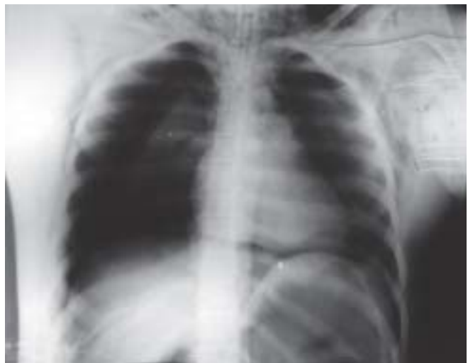
Figure 2 – Bilateral Pneumothorax.