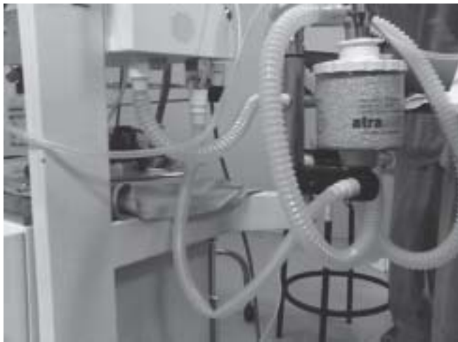
Figure 3 – A Kink in the Lower Tube Blocking the Flow of Gases.

revealed the presence of a kink in the tubing connecting the lower aspect of the canister to the device itself, blocking the flow of gases (Figure 3). This happened after mobilizing the device and the arm of the canister. The patient was discharged from the hospital three days later without further complications.