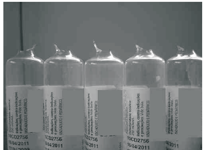
Figura 4 – Projeções Verticais na Borda de Abertura das Ampolas.

Cerca de 6% dos anestesiológistas apresentam ferimentos nas mãos provocados pela abertura de ampolas de vi-