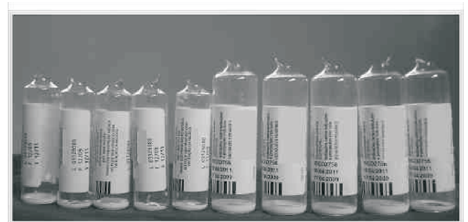
Figura 5 – Projeções Verticais na Borda de Abertura das Ampolas de Propofol (10 e 20 mL).