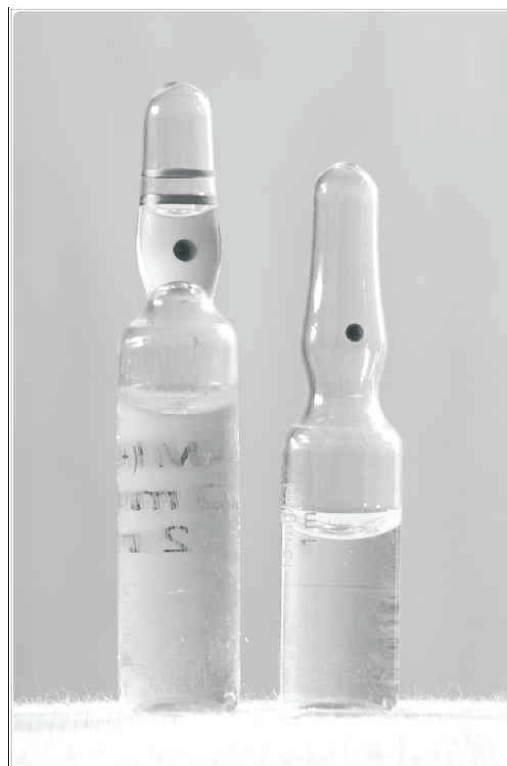
Figura 2 – Sistema OPC.