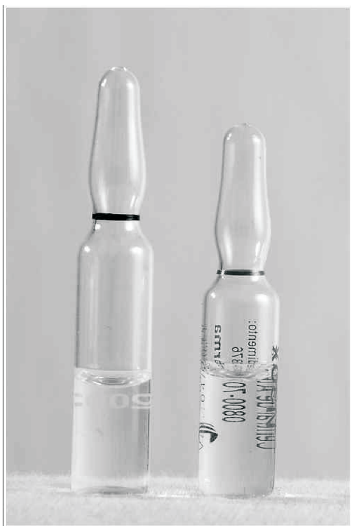
Figura 1 – Sistema VIBRAC.

Foram desenvolvidos sistemas facilitadores da abertura de ampolas na tentativa de se diminuir os incidentes pérfuro-cortantes e as contaminações dos conteúdos. Destacam-se o “anel de ruptura” (VIBRAC) e o “OPC” ( One Point Cut ou Único Ponto de Abertura). No Brasil, o sistema mais comum é o VIBRAC (Figura 1). Esse mecanismo pode ser encontrado