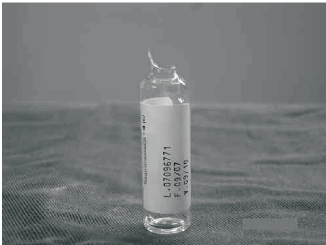
Figura 6 – Projeções Verticais na Borda de Abertura de uma Ampola de 4 mL.

dro. Vinte e seis por cento desses profissionais apresentam cicatrizes nas mãos pelo mesmo fator causal. Com a perda da continuidade causada por essas lesões, a contaminação da pele com sangue e secreções permite um ambiente propício para infecções por diversas doenças 13 . Mesmo assim, um grande número de anesthesiologistas negligencia o uso de luvas em sua atividade diária. O simples uso desse aparato de segurança impediria 98% do contato com sangue e secreções 8 . Os profissionais usam as mais variadas justificativas para o não uso de luvas. Entre elas, destacam-se perda de sensibilidade tátil, mau hábito, atitude conveniente, desconforto, falta de treinamento adequado e conhecimento de riscos, além de dificuldade para manipular fitas adesivas e esparadrapo 14 . Pesquisa recente demonstrou que uma política de uso obrigatório de luvas foi associada a uma redução significativa da incidência de lesões percutâneas com agulhas, ampolas e outros, e do nível de contaminação no local de trabalho do anestesista. O uso de luvas resultou em redução significativa de ferimentos percutâneos e em menor incidência de contaminação com sangue oculto em superfície de monitores, equipamentos de anestesia e materiais de uso pessoal como canetas e óculos 8,15 .